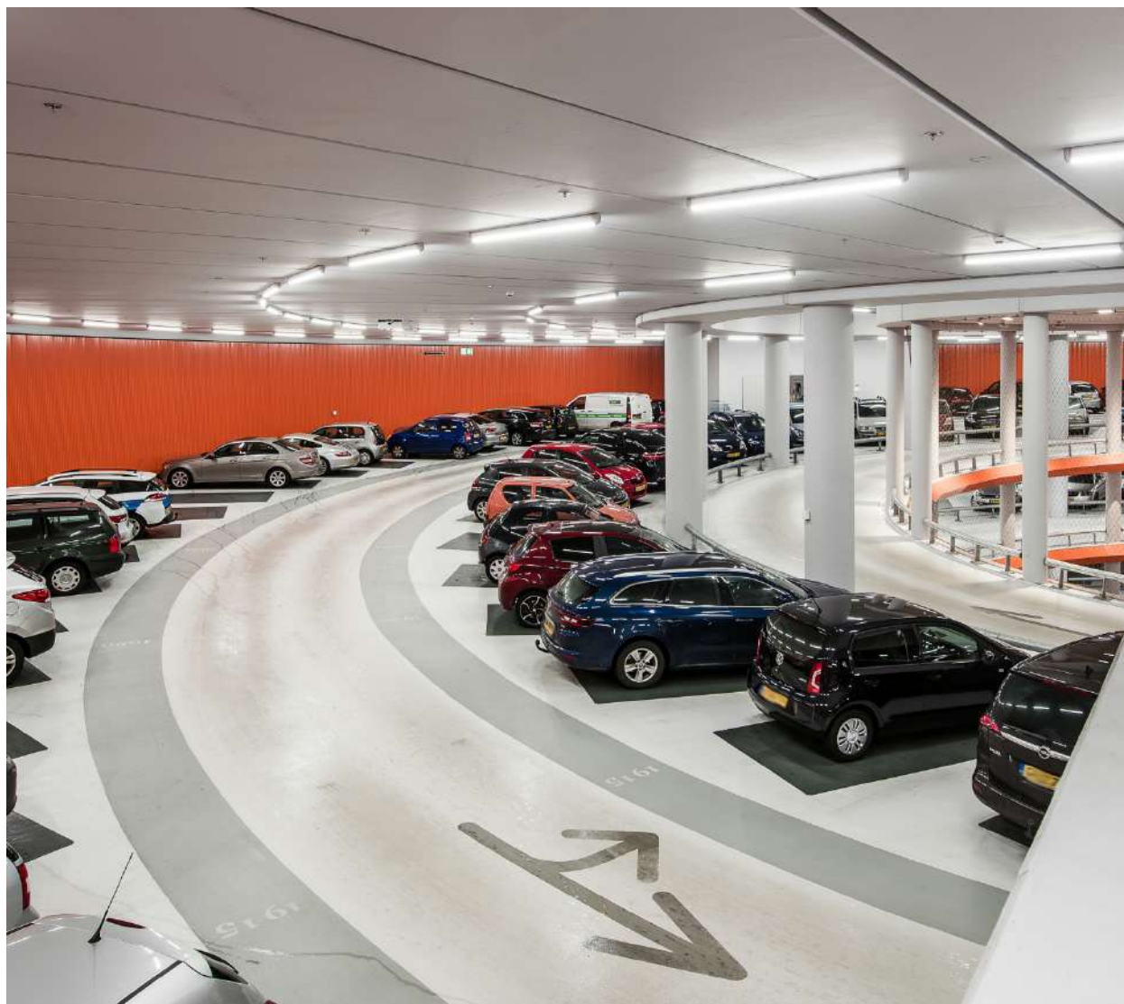
Revestimento de piso da Linha Sikafloor® usado em aeroporto da Holanda.

Adesivo Sika Anchorfix®-S de secagem rápida para fixação de elementos de sinalização viária, tachas, corrimãos e demais elementos complementares.