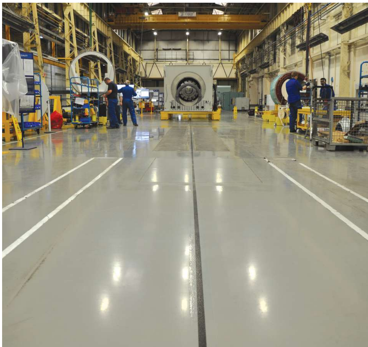
Área de armazenamento de cargas com sistema de piso Sikafloor®, solução durável, fácil de limpar e manter.

Com maior resistência a ciclos de lavagem e ação antibacteriana, as pinturas higiênicas da Linha Sikagard® são soluções seguras para áreas de preparação de alimentos, banheiros, áreas de apoio médico, etc.