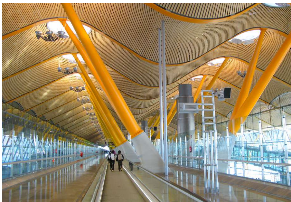
Sistemas de piso Sikafloor®, selantes Sikaflex® e adesivos Sikabond® utilizados no Aeroporto Internacional Madrid Barajas.

Linhas SikaWall® de nivelamento de paredes e linha completa de argamassas colantes e rejuntas para revestimento cerâmico em áreas internas e externas.