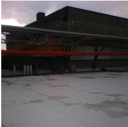
Tratamento com manta de PVC.