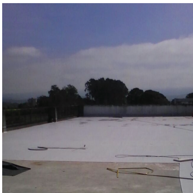
Tratamento com manta de PVC.