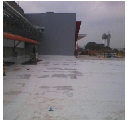
Tratamento com manta de PVC.