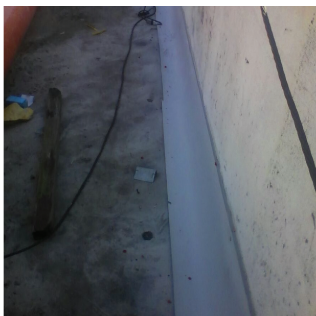
Tratamento com manta de PVC.