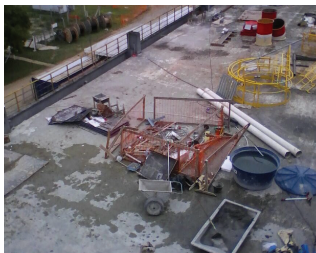
Tratamento com manta de PVC.

Trata-se de laje de concreto em ambiente industrial. Verificou-se pontos vulneráveis a infiltração e pontos de deslocamento da impermeabilização existente. Contudo optou-se por fazer uma nova impermeabilização para sanar os problemas citados na avaliação.