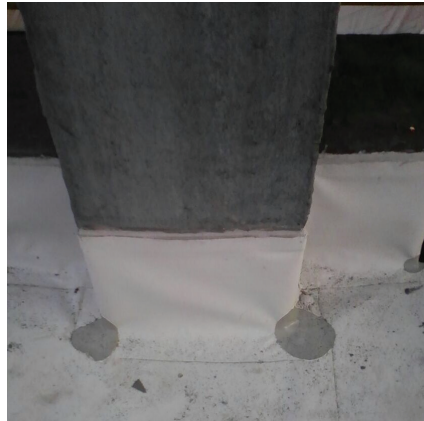
Tratamento com manta de PVC.