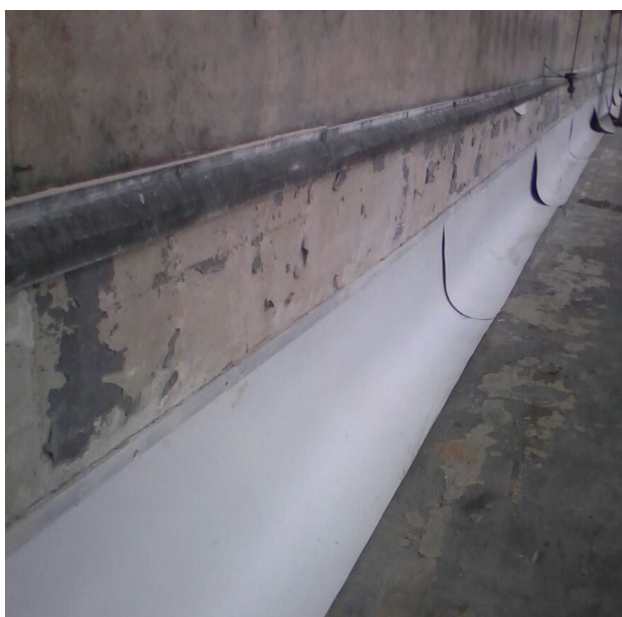
Tratamento com manta de PVC.