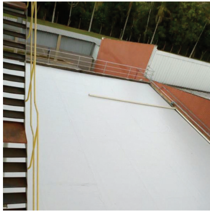
Impermeabilização de alto desempenho com manta de PVC.