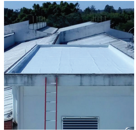
Impermeabilização de alto desempenho com manta de PVC.