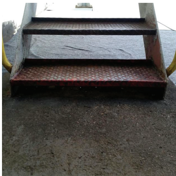
Impermeabilização de alto desempenho com manta de PVC.