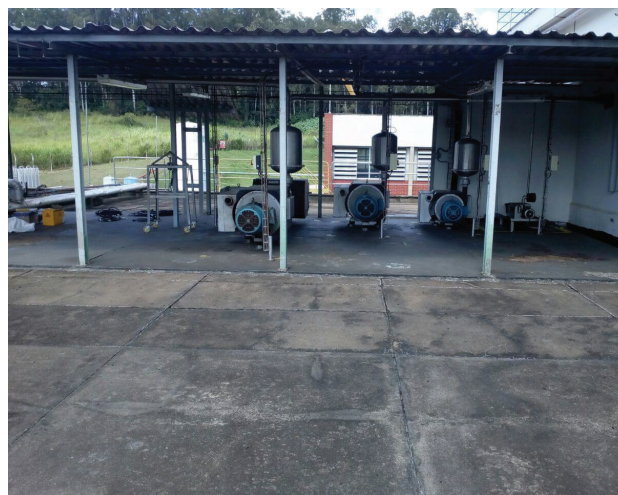
Impermeabilização de alto desempenho com manta de PVC.

Tratam-se de lajes em concreto em ambiente industrial. Verificaram-se pontos vulneráveis a infiltração. Contudo optou-se por fazer uma impermeabilização para sanar os problemas citados na avaliação.