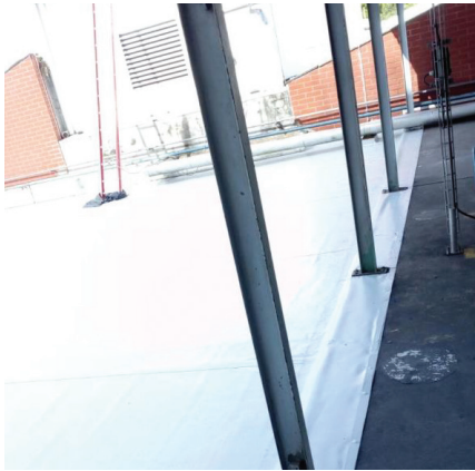
Impermeabilização de alto desempenho com manta de PVC.