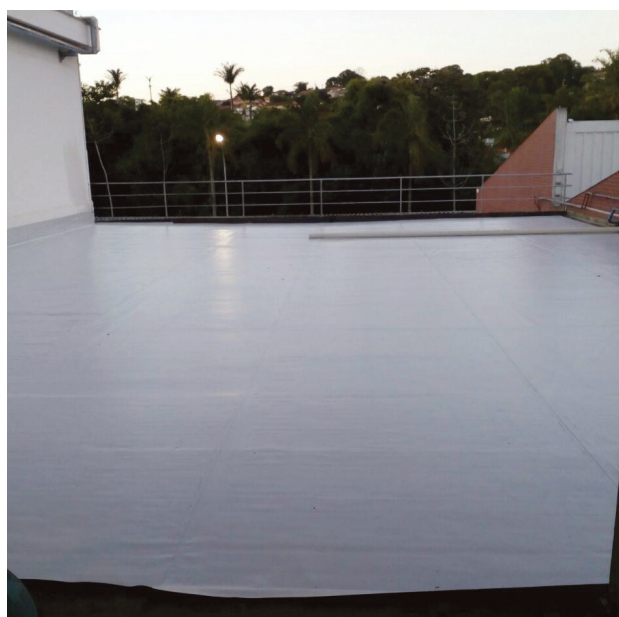
Impermeabilização de alto desempenho com manta de PVC.