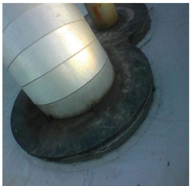
Impermeabilização de alto desempenho com manta de PVC - Egron II