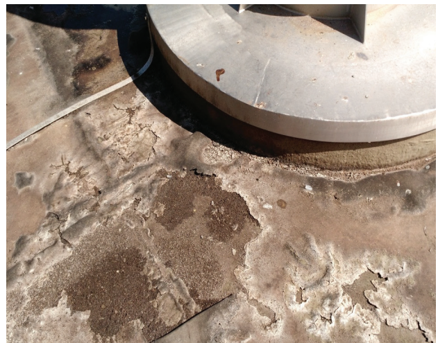
Impermeabilização de alto desempenho com manta de PVC - Egron II

Trata-se de laje de concreto em ambiente industrial. Verificaram-se pontos vulneráveis a infiltração e pontos de deslocamento da impermeabilização existente na laje. Contudo optou-se por fazer uma nova impermeabilização para sanar os problemas citados na avaliação.