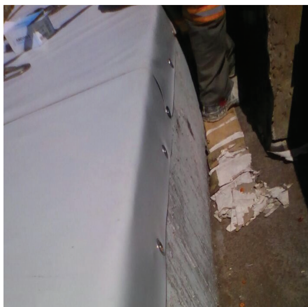
Impermeabilização de alto desempenho com manta de PVC - CCM.