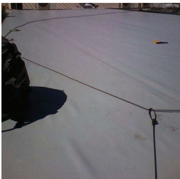
Impermeabilização de alto desempenho com manta de PVC - CCM.