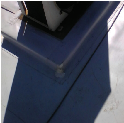
Impermeabilização de alto desempenho com membrana de PU - CCM