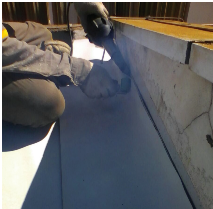
Impermeabilização de alto desempenho com membrana de PU - CCM