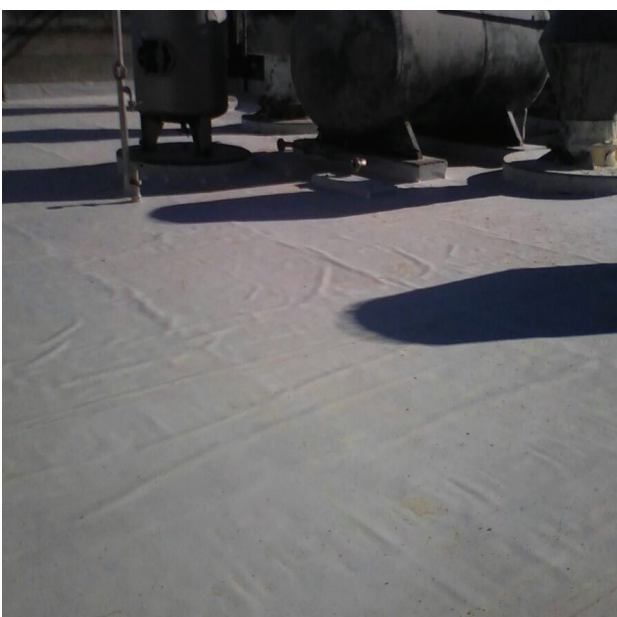
Impermeabilização de alto desempenho com manta de PVC - Egron II