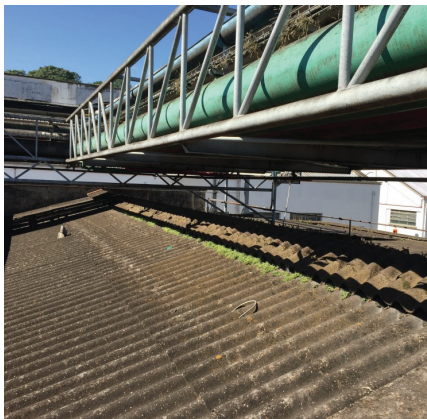
Telhado em ambiente industrial.