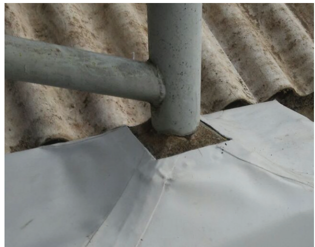
Impermeabilização de alto desempenho com manta de PVC. (Sarnafil®)