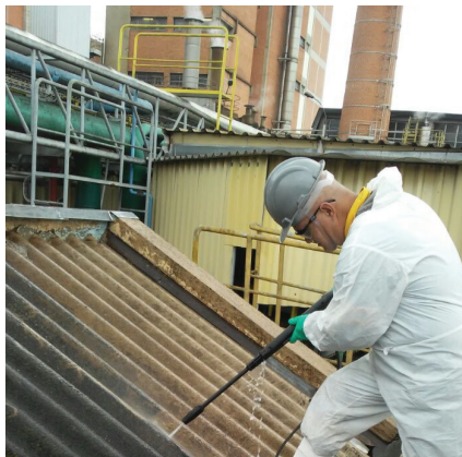
Tratamento da superfície.