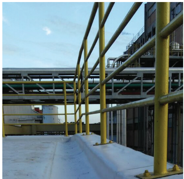
Impermeabilização de alto desempenho com manta de PVC