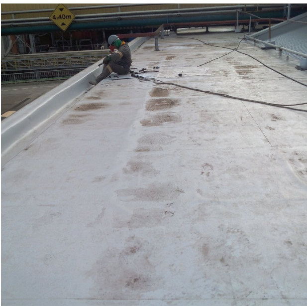
Impermeabilização de alto desempenho com manta de PVC