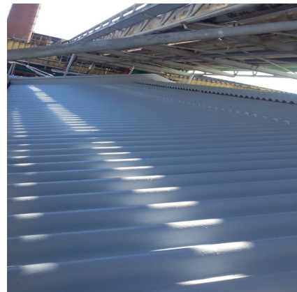
Impermeabilização de alto desempenho com membrana de PU Sikalastic®-612