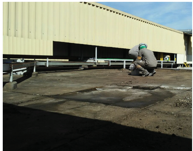
Impermeabilização de alto desempenho com manta de PVC

Trata-se de laje de concreto e telhado em ambiente industrial. Verificaram-se pontos vulneráveis a infiltração e pontos de deslocamento da impermeabilização existente na laje e no telhado verificaram-se pontos de infiltração nas emendas e eflorescência. Contudo optou-se por fazer uma nova impermeabilização para sanar os problemas citados na avaliação.